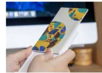
九谷焼ワイヤレス充電器 スタンド型 パネル部分単体 本体価格 ¥2,000+税