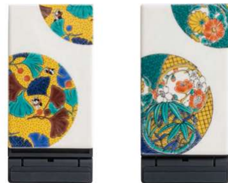
ELS3020 麗和いちよう 本体価格 ¥7,500+税 ELS3021 麗和はなまる 本体価格 ¥7,500+税