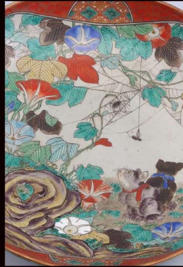
色絵朝顔仔猫回平鉢 九谷 庄三 1816(文化13)~1883(明治16)年 能美市九谷焼美術館 五彩磁器