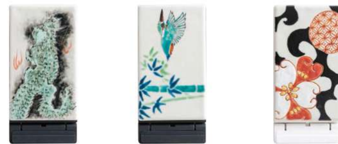
ELS3024 登り龍 谷教正人 本体価格 ¥20,910+税 ELS3025 かわせみず 佐藤剛志 本体価格 ¥14,546+税 ELS3025 彩華小紋 紺 佐藤剛志 本体価格 ¥14,546+税