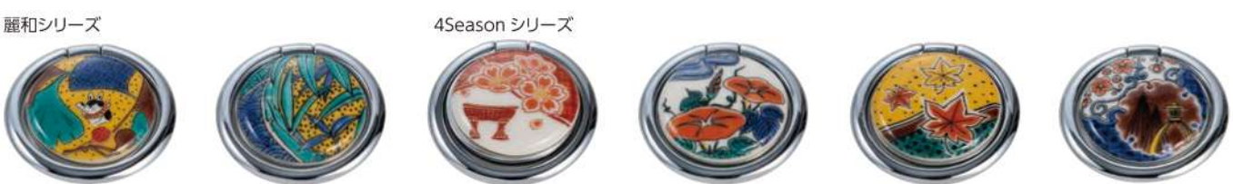
ELS3022 麗和いちよう 本体価格 ¥3,000+税 ELS3023 麗和はなまる 本体価格 ¥3,000+税 ELS3045 春の麗 (うらら) B 本体価格 ¥3,000+税 ELS3047 夏の優 (やわらぎ) B 本体価格 ¥3,000+税 ELS3049 秋の華 (はなやぎ) B 本体価格 ¥3,000+税 ELS3051 冬の雅 (みやび) B 本体価格 ¥3,000+税