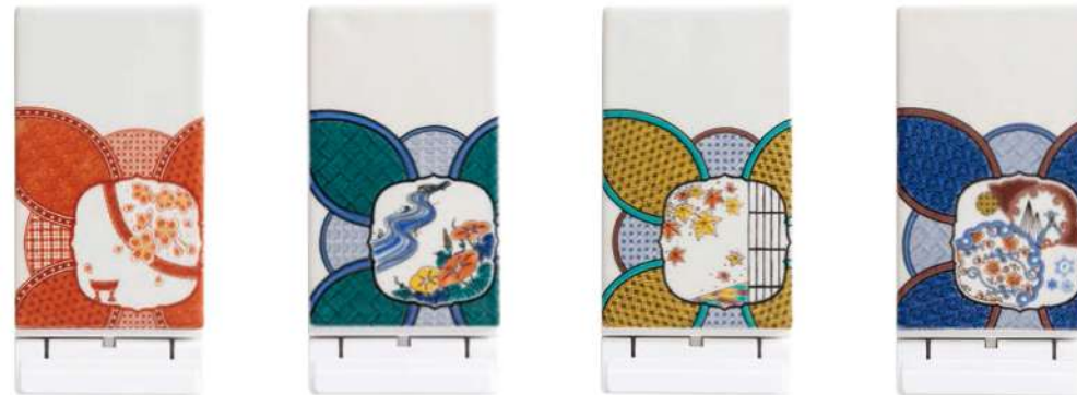
ELS3022 春の麗 (うらら) 本体価格 ¥7,500+税 ELS3023 夏の優 (やわらぎ) 本体価格 ¥7,500+税 ELS3024 秋の華 (はなやぎ) 本体価格 ¥7,500+税 ELS3025 冬の雅 (みやび) 本体価格 ¥7,500+税

■本体色 /WH ■材質 /ABS、磁器 ■サイズ / (本体) 長 142×幅 70×厚 約 13mm、125g ■仕様 /入力 5V/2.0A! 9V/1.8A、出力 5W/7.5W/10W ■付属品 /microUSB ケーブル 90cm、取扱書兼保証書