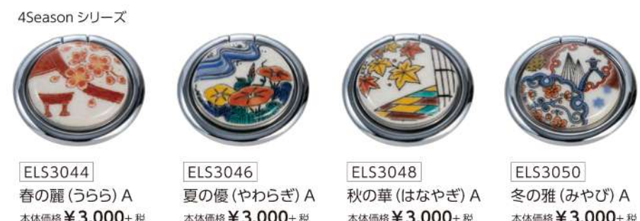
ELS3044 春の麗 (うらら) A 本体価格 ¥3,000+税 ELS3046 夏の優 (やわらぎ) A 本体価格 ¥3,000+税 ELS3048 秋の華 (はなやぎ) A 本体価格 ¥3,000+税 ELS3050 冬の雅 (みやび) A 本体価格 ¥3,000+税